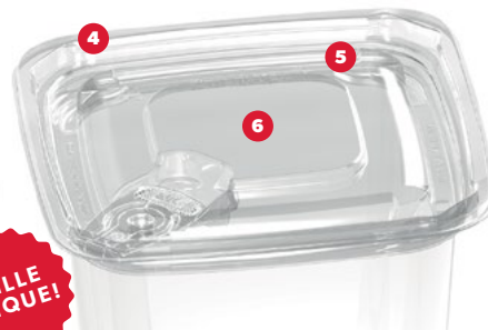
Montré avec la tirette vers le bas